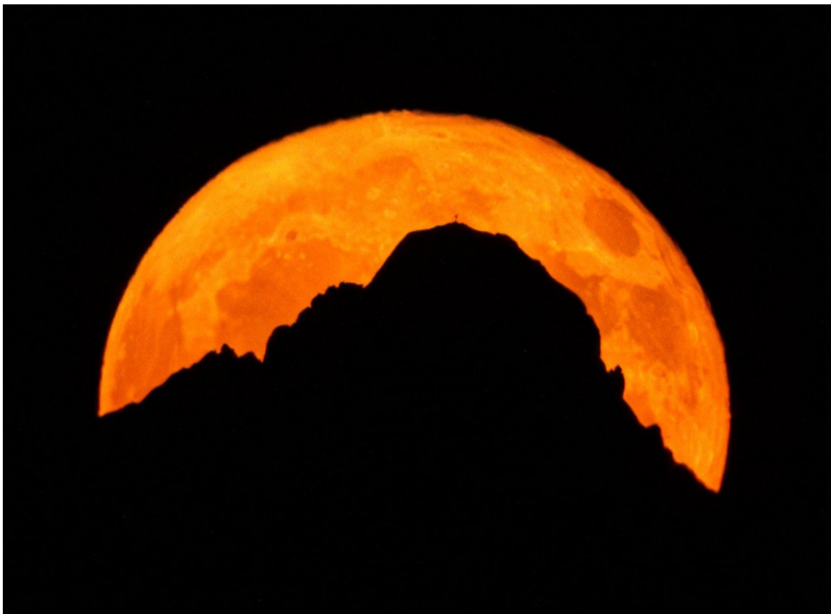
Das Foto zeigt den fast vollen Erdbeermond, wie er am Mittwoch um 22.40 Uhr hinter der Zimbaspitze aufgeht.